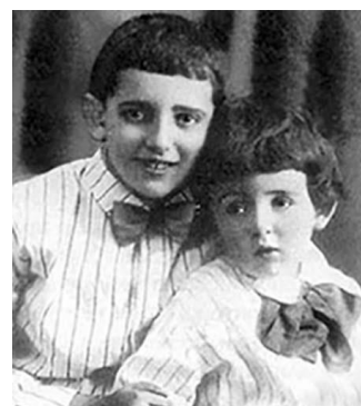
А. Галич с младшим братом

Александр Галич (настоящая фамилия Гинзбург) родился 19 октября 1918 года в городе Екатеринославе (ныне Днепропетровск), в семье служащих. Благодаря матери Александр уже в раннем возрасте начал увлекаться творчеством — с пяти лет он учился играть на рояле, писать стихи. В восемь лет он стал заниматься в литературном кружке, которым руководил поэт Эдуард Багрицкий. В школе Александр учился на «отлично» и был всеобщим любимцем — кроме прекрасной игры на рояле, он хорошо танцевал, пел революционные песни, декламировал стихи. Впервые опубликовал стихотворение «Мир в рупоре» в газете «Пионерская правда» 23 мая 1932 года за подписью Александр Гинзбург.