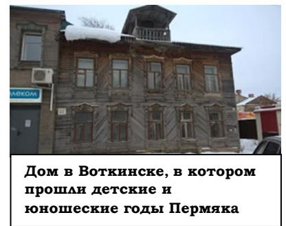
Дом в Воткинске, в котором прошли детские и юношеские годы Пермяка

Пермяк – псевдоним автора, настоящая фамилия его была Виссов. Родился Евгений Андреевич Виссов в 1902 году, 31 октября, в городе Перми. Однако был в первый же год жизни отправлен вместе с матерью в Воткинск. В детские годы будущий автор возвращался в родной город, гостил у родственников, однако визиты были короткие и редкие. Большую же часть детства и юные годы маленький Женя провел в Воткинске с мамой, тётёй, бабушкой и дедушкой, которые его очень любили и заботились о нем. Отец Евгения, мелкий почтовый служащий, скончался от чахотки, когда сыну было три года.